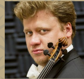
ANDREY BARANOV Violín

Conectaron con la esencia musical de las tierras que les vieron crecer y convirtieron sus obras en imanes para el público. Superaron adversidades, críticas y censuras; se refugiaron bajo los árboles y cantaron al mar y a la noche. Con maravillosos juegos modales de aroma rumano, Ligeti y Kodály, entre vivos contrastes. En el silencio de los bosques, Sibelius, con un violín de encanto infinito. Navegando por el río, tranquilo pero imparable, el bello Orawa de Wojciech Kilar.