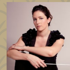
ALONDRA DE LA PARRA Directora/Zuzendaria